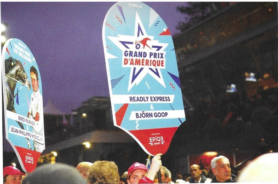
Ci-dessus: les quatorze courses les plus prestigieuses ont été regroupées dans le parcours Epique Series, avec une communication plus moderne. Ci-dessous: parier sur un cheval enrichit l'expérience sur l'hippodrome, en ajoutant de l'adrénaline, selon France Galop.

C'est dans cette optique que Le Trot, France Galop et le PMU ont lancé les Epique Series, un circuit s'appuyant sur les quatorze courses les plus prestigieuses mais encore davantage mises en avant pour le public, grâce à un marketing plus moderne et dynamique. Mais surtout, modernité est aujourd'hui synonyme de technologie, et le monde des courses, très attaché à la tradition, doit s'y plier.