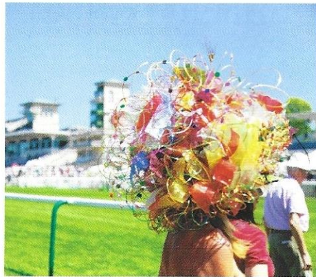
Les événements organisés autour des courses renommées, comme le concours de chapeaux du Longines Prix de Diane, attirent les néophytes sur les hippodromes.

Les mondes des courses font écho à un certain prestige, celui des chapeaux qui paraissent lors du Longines Prix de Diane, ou du Qatar Prix de l'Arc de Triomphe. Cependant, une autre réalité entre en jeu dans l'ombre des courses les plus renommées: le vieillissement du public et les hippodromes de plus en plus vides. Depuis quelques années, les parieurs, qui représentent environ quatre millions de personnes en France, sont de moins en moins nombreux à se presser pour miser sur leur numéro favori. Selon le rapport annuel de l'autorité de régulation des jeux en lignes (ARJEL), le montant des enjeux sur les paris en ligne a encaissé une baisse de